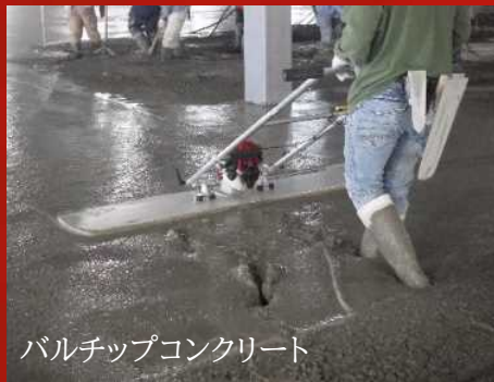
バルチップコンクリート