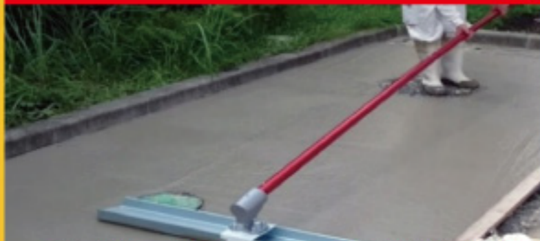
コンクリート均し、アマ(ノロ)出し作業