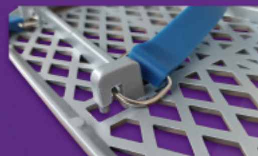
運搬中にバンドがはずれる心配なし