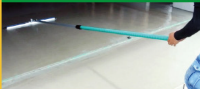
アマ出し、追いか、仕上げ