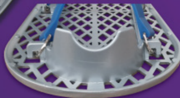
キックバック付の靴にも対応